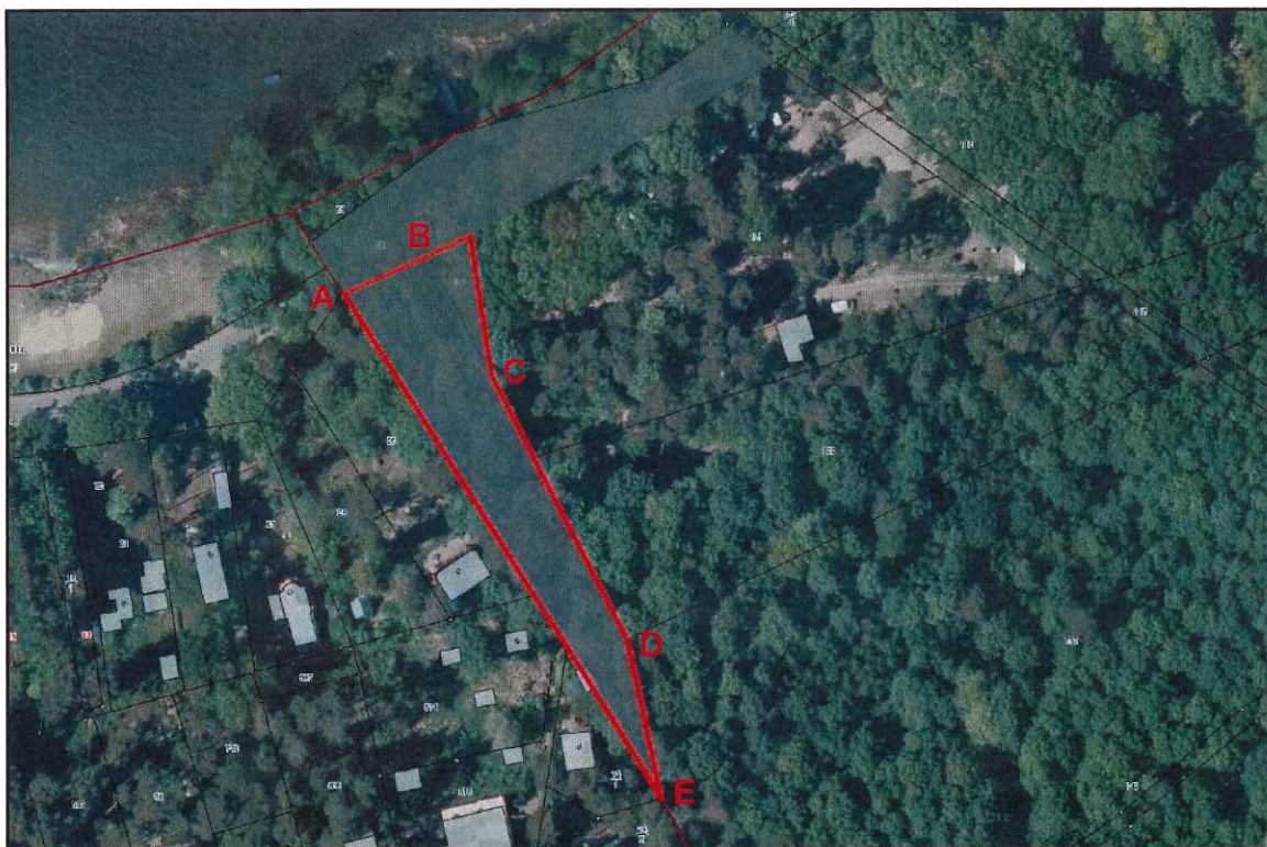
Luftbild aus ARCHIKART der StraÙe „DorfstraÙe“ Lage rot umrandet dargestellt