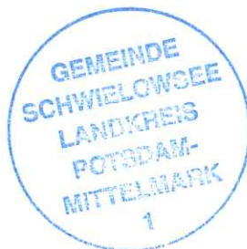
K. Hoppe Bürgermeisterin der Gemeinde Schwielowsee