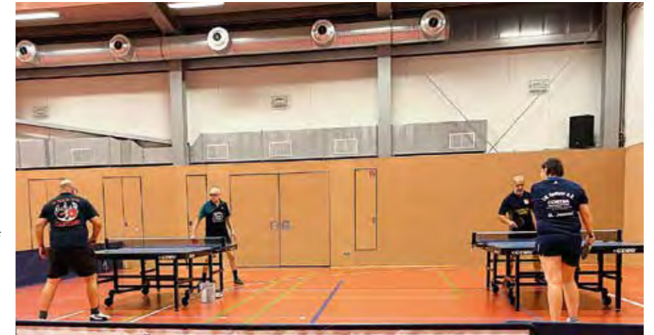
Szene aus dem Spiel gegen den SV Ferch, das mit 13:1 gewonnen wurde

Die VIII. Mannschaft der SG Geltow wünscht allen einen guten Start in das Jahr 2024 und würde sich über neue Mitspieler freuen. ■ Siegmars Schulz