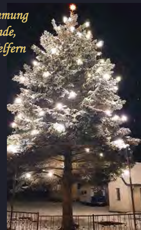
Verschnittene Tanne im Mühlengrund