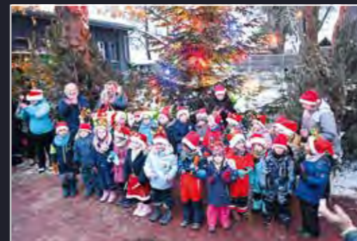
Zur Eröffnung führten die Fercher Kitakinder ein tolles Programm mit Weihnachtsliedern und Tanz auf

Leider kein Fanfarenzug, da Corona einige Spielleute erwischte. Trotzdem hatten die Kleinen mit Lampions und Fackeln Spaß am abendlichen Treiben. Die Feuerwehr sorgte für die Sicherheit und musste einen Autofahrer ermahnen, der seinen Skoda fast mitten auf der Straße parkte.