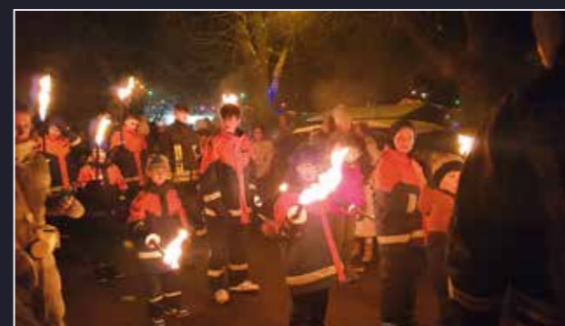
Pünktlich um 18 Uhr ging die Feuerwehrjugend mit Fackeln und Lampions einmal auf Rundkurs durchs Dorf

Viele Leute, Budenzauber, langes Anstehen an den Würstchen- und Glühweinständen. Trotzdem breitete sich Frohsinn auf den Gesichtern der Fercher und ihrer Gäste aus. Sogar der Weihnachtsmann war dabei und machte auch die kecksten Bübchen lammfromm. Ein schönes Fest zum Treffen und Erzählen in einer lebhaften Dorfgemeinschaft. ■ Marina Katzer