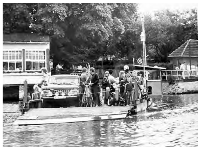
Schon in den Achtzigern herrschte Hochbetrieb auf der „Tussy“

werden. Wir wollen den Caputhern und ihren Gästen zeigen, wie wichtig diese Wasser-Verbindung für den Ort ist, wie sie sich seit ihrer Inbetriebnahme 1853 entwickelt hat, und dabei auch zum Teil kuriose Zwischenfälle beleuchten. Viele historische Gegenstände, von der Glocke bis zum Schiffsmotor, von alten Grundstücksurkunden über technische Zeichnungen und Gemälde bekannter Künstler bis hin zu Fotos und Zeitungsberichten aus Vergangenheit und Gegenwart hat die Suche bereits zutage gefördert. Jeder weitere Fund würde das Bild ergänzen und abrunden. Der Vorstand des Heimatvereins bittet daher nicht nur die Caputher, sondern alle heimat-