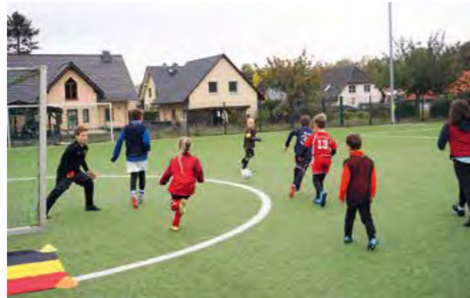
Nicht nur die Jungen jagten dem Ball hinterher

gerehrung und Auswertung des Camps erhielten alle Teilnehmer eine Erinnerungsmedaille, eine DFB-Fußballurkunde und ein DFB-Fußballabzeichen. Zudem wurden die Wettbewerbssieger der jewei-