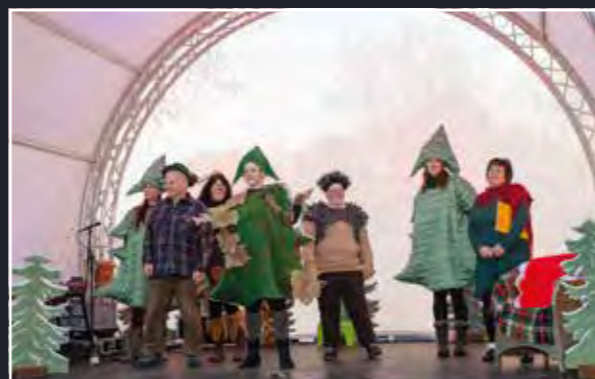
Die „Geschichte vom kleinen Tannenbäumchen“ – liebevoll aufgeführt für die Kleinsten vom Caputher Chorfasching

mantisches Lichtermeer. Traditionell hat der Männerchor „Einigkeit“ am 2. Adventswochenende Groß und Klein eingeladen und mit einem bunten Programm verzaubert. Von Weihnachtsliedern, gesungen vom