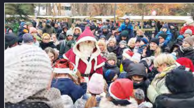
Natürlich war der Weihnachtsmann wieder die Hauptattraktion