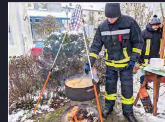
Die Feuerwehr heizte mit Erbsensuppe tüchtig ein

Am Stand der FFW wurde eine heiße Erbsensuppe mit Würstchen angeboten. Auf der Bühne gaben der Frauen- und der Männerchor einen kleinen Einblick in ihr Repertoire. Die „Ropeskipping Kids“ und die Zirkus-AG der Meusebachschule führten ihre akrobatischen Kunststücke auf. Der Weihnachtsmann wurde von vielen kleinen und großen Kindern umzingelt, sodass seine Gaben sehr schnell verteilt waren. ■ Regina Petschke