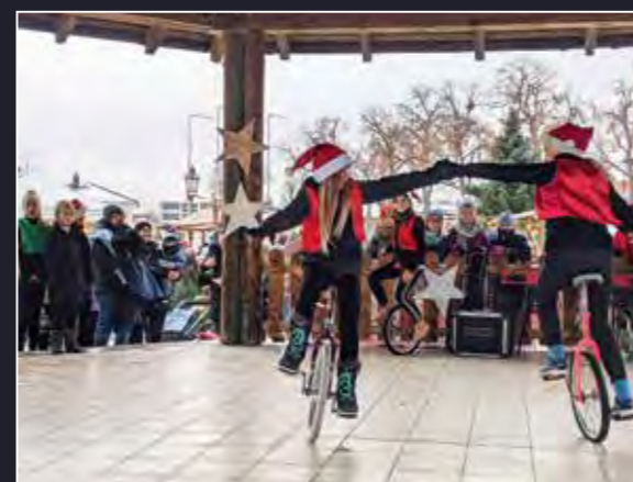
Viel Beifall fanden die Kunststücke der Artisten der Meusebach-Zirkus-AG

Am ersten Samstag im Dezember fand wieder der Geltower Weihnachtsmarkt auf dem Platz am Fontanering statt. In diesem Jahr wurden mehr Stände aufgebaut, es kamen mehr Besucher und es gab den ersten Schnee.