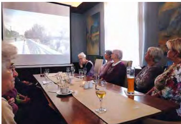
Noch nicht alle Senioren haben schon die neue Fußgänger- und Radfahrerbrücke in Wildpark West „bezungen“

wissenschaftliche Schilderungen parat. Für einige waren manche Erklärungen zu den Objekten völlig neu, wie die zwei nebeneinanderstehenden und unterschiedlich großen Windmühlen in Langerdehaus. Beeindruckend zeigte Reinhold auf, wie besonders die Kirchen in der Vergangenheit in den Dörfern den Mittelpunkt des gesellschaftlichen Lebens prägten. Aber nicht nur geschichtliche Vergangenheit zeigten die Fotos an der Projektionswand. So schlugen zahlreiche Herzens schneller, als auf der Leinwand die neue Fußgänger- und Radfahrerbrücke als Verbindung von Wildpark West nach Werder (Havel) zu erkennen war. „Es gibt auch was aktuell Positives in unserer Nähe“, wurde kommen-