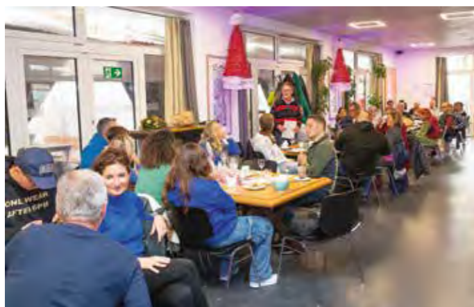
Gestärkt und in schöner Atmosphäre – Mitglieder des Caputher Wasserskiclubs