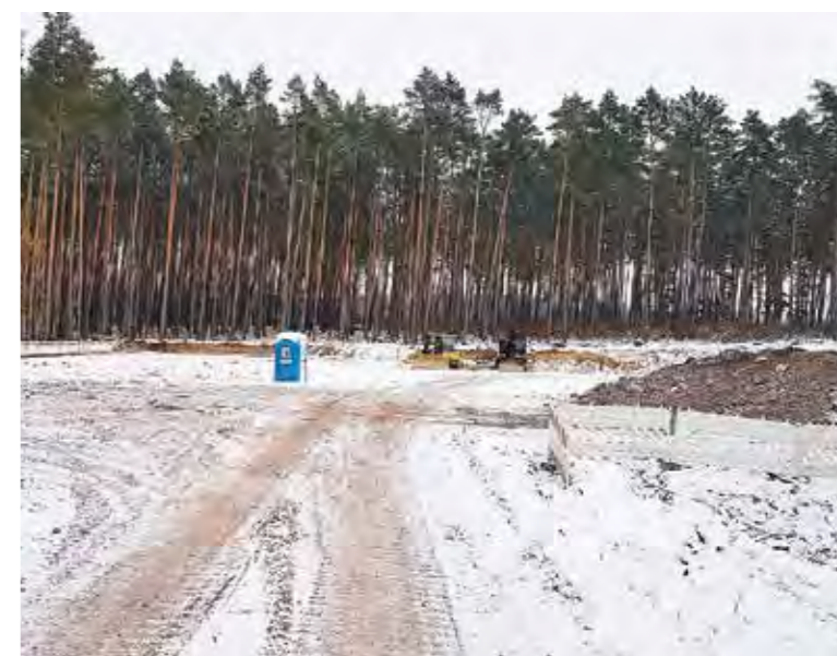
Baustelle Windrad „Am Dachsberg“ im Winterschlaf