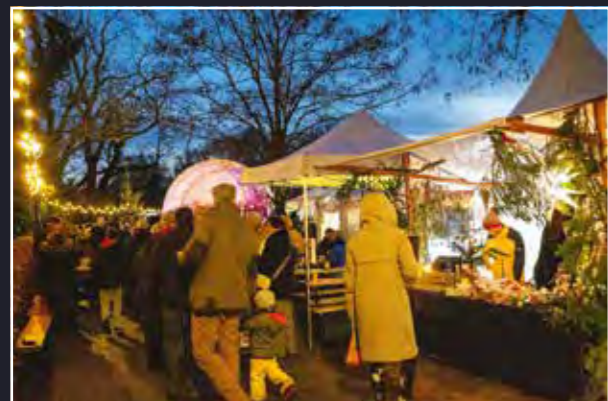
Weihnachtlicher Lichterglanz am Gemünde

Zelten gab es Leckereien und allerlei kunstvolles Handwerk zu bestaunen und zu kaufen. Um seinen Rentieren noch ein wenig Ruhe vor dem Heiligen Abend zu gönnen, winkte der Weihnachtsmann stattdessen von seinem weihnachtlich geschmückten Schlauchboot den staunenden Kindern am Ufer zu und war nur wenig später mit einem Sack voller kleiner Leckereien mitten unter den Schaulustigen. ■ Thomas Kühne